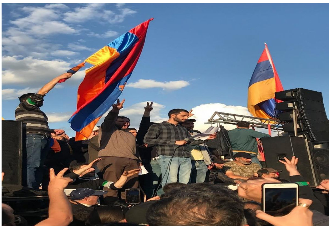
На фото: Рубен Рубинян и Сурен Папикян, 23 апреля 2018 года