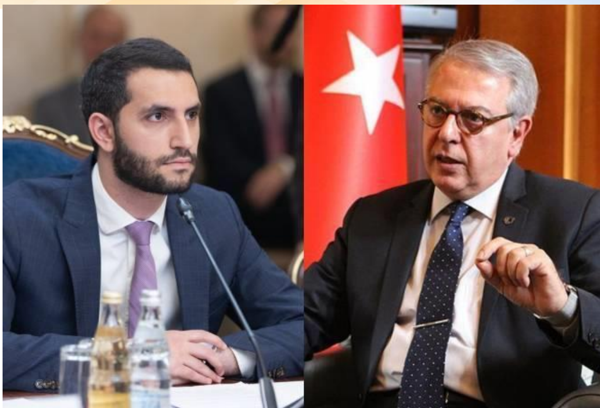
На фото: Рубен Рубинян и Сердар Кылыч

Назначение вызвало споры сразу по двум причинам. Оппоненты власти обращали внимание как на отсутствие у Рубиняна практического дипломатического опыта, особенно на фоне его турецкого визави Сердара Кылыча, которого называют одним из наиболее опытных представителей турецкой дипломатии, так и на законность самой процедуры назначения.