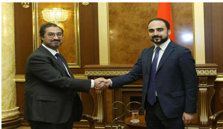
Авинян и представитель Masdar

https://masdar.ae/en/our-company/our-shareholders#:~:text=Masdar%20is%20owned%20by%20three,(TAQA)%20and%20Mubadala%20Investment%20Company.