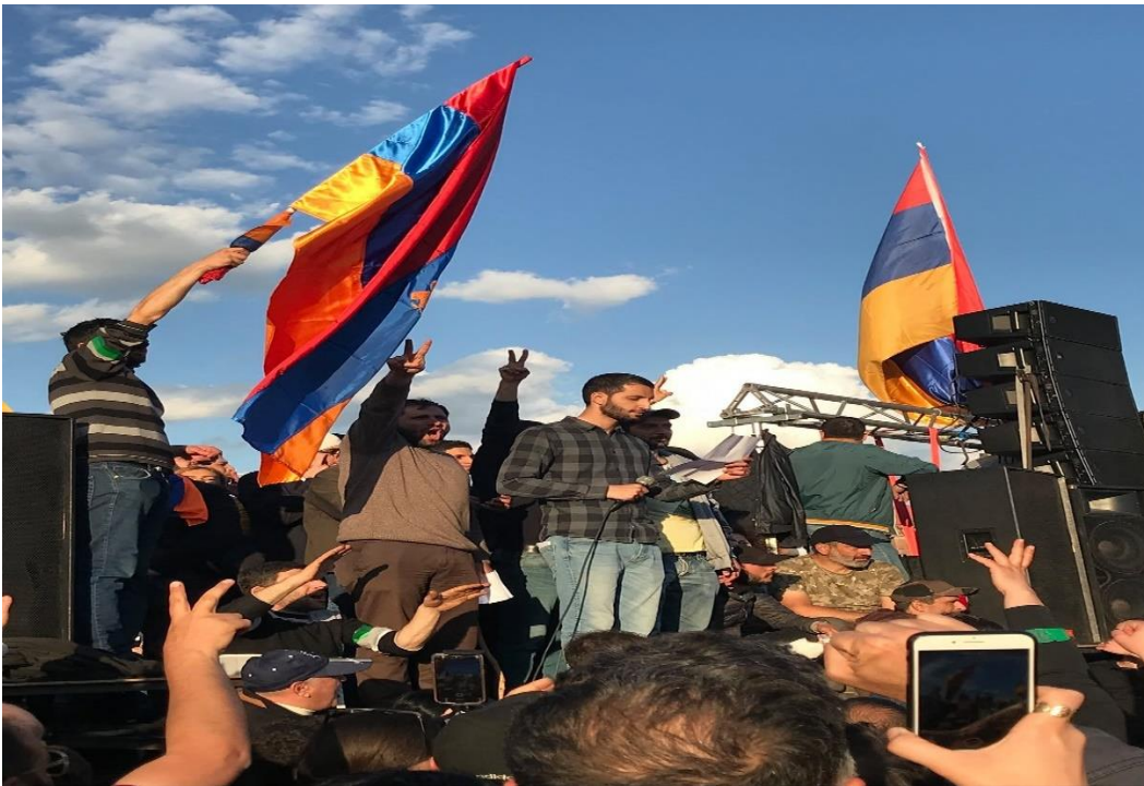
Լուսանկարում՝ Ռուբեն Ռուբինյանը և Սուրեն Պապիկյանը, 2016 թ. ապրիլի 23

Այս քաղաքական կապերի պահպանումը թույլ է տալիս ավելի լավ հասկանալ, թե ինչու է Ռուբեն Ռուբինյանը մի քանի տարի շարունակ մնում գործող իշխանության